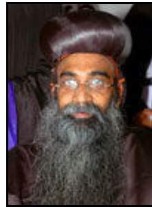
അഭി. ഡോ. യുഹാനോൻ മാർ ക്രിസോസ്റ്റമോസ്