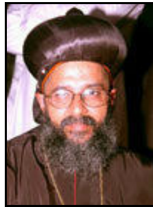
അഭി. ഡോ. സഖറിയാസ് മാർ തെയോഫിലോസ്