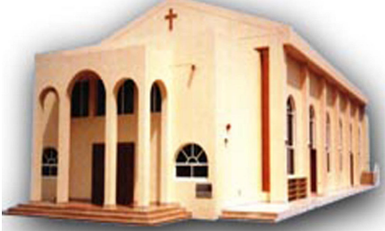
1995 മാർച്ച് 31-ാം തീയതി കുദാശചെയ്യപ്പെട്ട പത്ത് വർഷം പിന്നിടുന്ന നമ്മുടെ വി. ദൈവാലയം