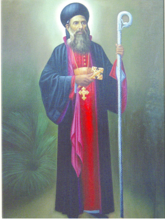
ഇടവകയുടെ കാവൽ പിതാവ് പരിശുദ്ധ പരുമല തിരുമേനി

ഷാർജ്ജയിൽ സ്വന്തമായി ഒരു ദൈവാലയം ആദ്യമായി മലങ്കരസഭയ്ക്ക് അനുവദിച്ചുതന്ന ഈ രാജ്യത്തിലെ എല്ലാ ഭരണാധിപൻമാരോടും കുടുംബാംഗങ്ങളോടും പ്രത്യേകിച്ച് ഷാർജ്ജ ഭരണാധികാരിയും, സുപ്രീം കൗൺസിൽ അംഗവുമായ ബഹു. ഡോ. ഷെയ്ക്ക് സുൽത്താൻ ബിൻ മുഹമ്മദ് അൽ ഖാസ്മിയോടും ഇടവയ്ക്കുള്ള നന്ദിയും കടപ്പാടും ഒരിക്കൽ കൂടി അറിയിക്കുന്നു.