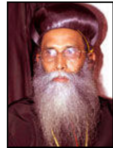
അഭി. ഔഗോൻ മാർ ദീവന്നാസ്യോസ്